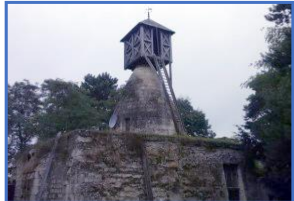
Le moulin des Vaux