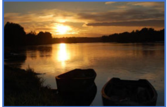
Entre Vienne et Loire