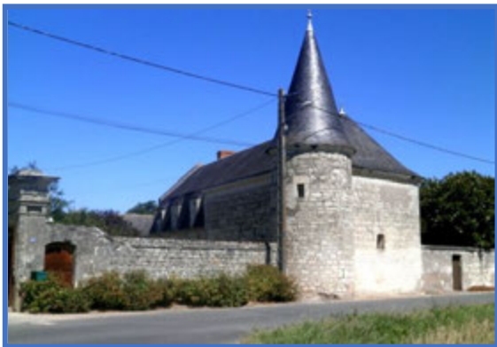
Le manoir des Places