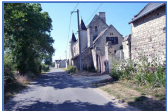
Le manoir de Cheviré