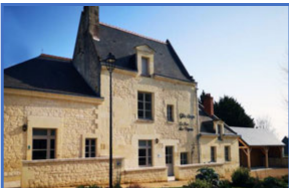
Le Pas des Vignes, Gite de groupe